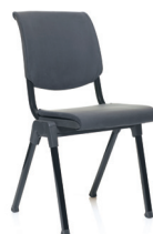
HÅG Conventio 9510