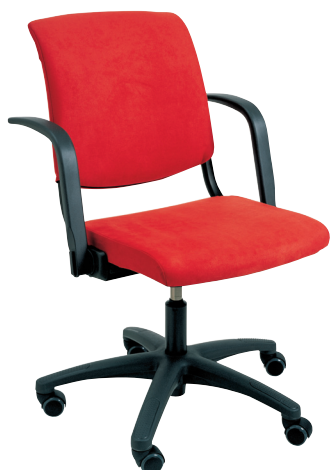
HÅG Conventio 9522 / armleggers (optie)