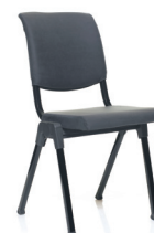
HÅG Conventio 9520