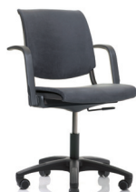
HÅG Conventio 9512 / armleggers (optie)